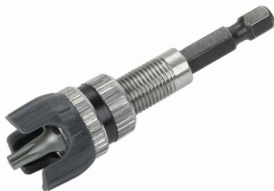
DRŽÁK BITŮ S DORAZEM; STOPKA 6-HRAN