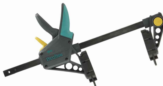
MONTÁŽNÍ TERASOVÁ SVĚRKA; DÉLKA 450MM