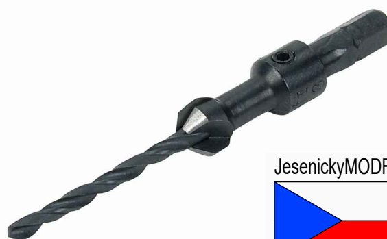
PŘEDVRTÁK SE ZÁHLUBNÍKEM STOPKA: 6-HRAN