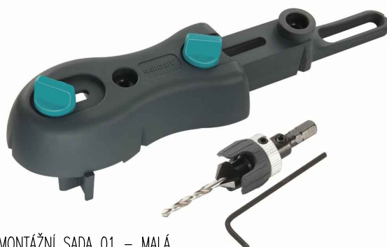
MONTÁŽNÍ SADA 01 – MALÁ 01) PŘEDVRTÁK SE ZÁHLUBNÍKEM A DORAZEM; 02) VRTACÍ PŘÍPRAVEK;